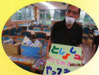
図書館開催しているよ！ 一緒に本読もうー！