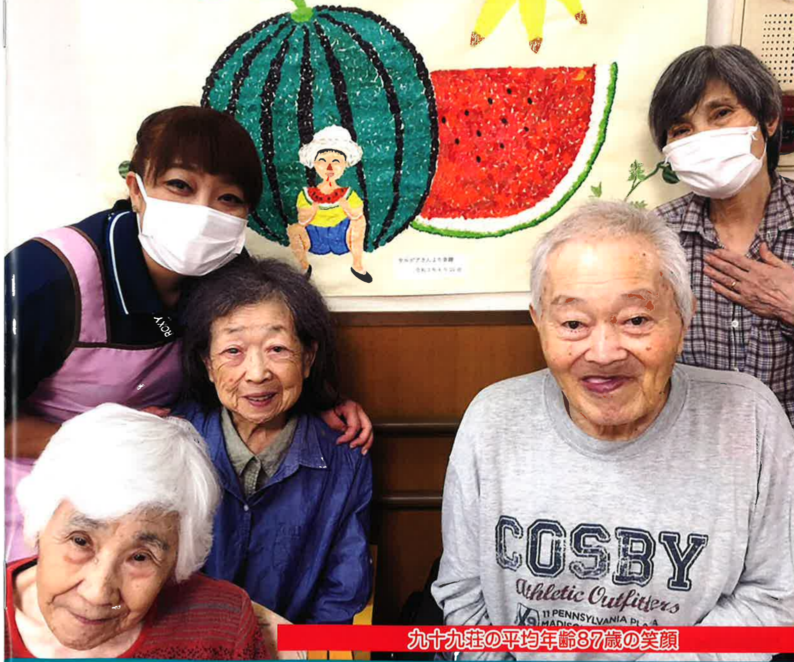
九十九荘の平均年齢87歳の笑顔

No.72 2021.10発行 社会福祉法人 清郷会 協和厚生園/日吉厚生園/九十九荘 十倉厚生園/デイとくら・輝 青空保育園/ワークわく・きよさと ほっとライフ・きよさと TEL0476(93)1535(代)