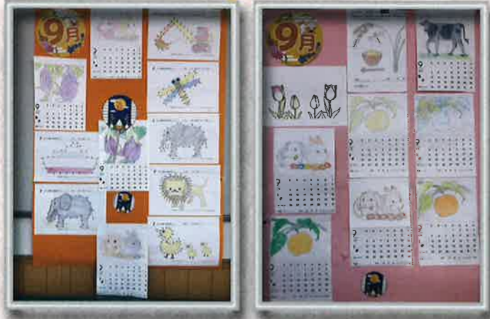
「毎月のカレンダー」 九十九荘 特養では毎月、利用者の皆さんが塗り絵をしてきて、カレンダーを賑やかにしてくれています。