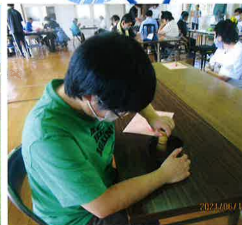
茶筌でお茶を点てましょう