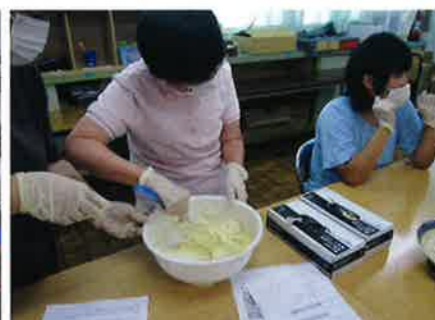
生クリームを泡立てるのが大変でした