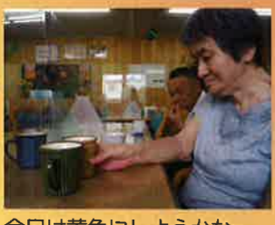
今日黄色にしようかな～