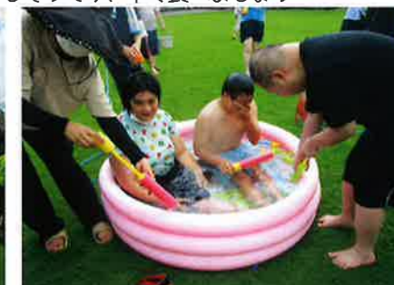
全身ずぶぬれ、プールに入って休憩です