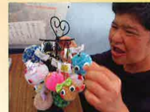
ポンポンストラップ。かわいいでしょー！売れるかな～