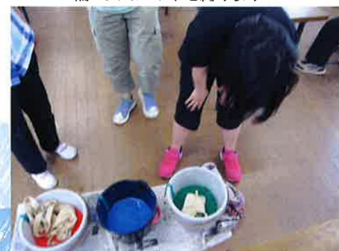
何色に染めましょうか