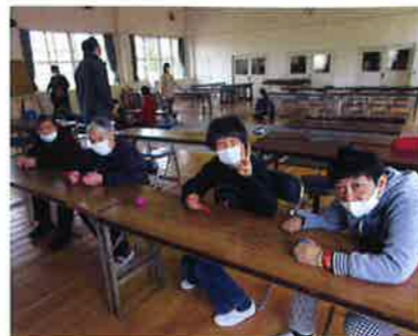
タマゴの中のお菓子もいただきました