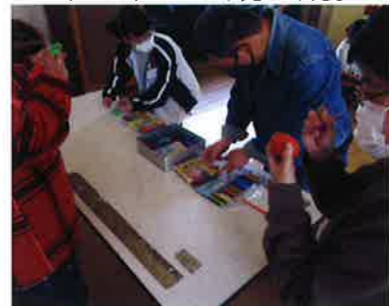
タマゴに好きな絵をぬりましょう