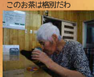
このお茶は格別だわ