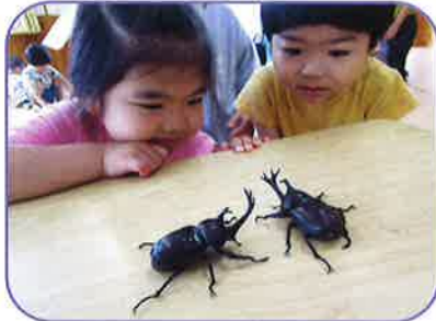
理事長先生がたくさんかぶと虫をつかまえてきてくれました

かたちの行事、活動も子ども達の笑顔と「楽しみに癒され、職員も頑張りました。」と感じました。 真と一緒に青空保育園