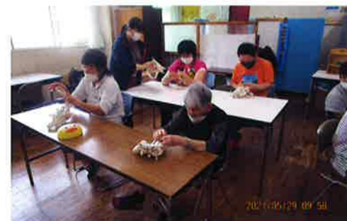
輪ゴムでバッグを縛ります