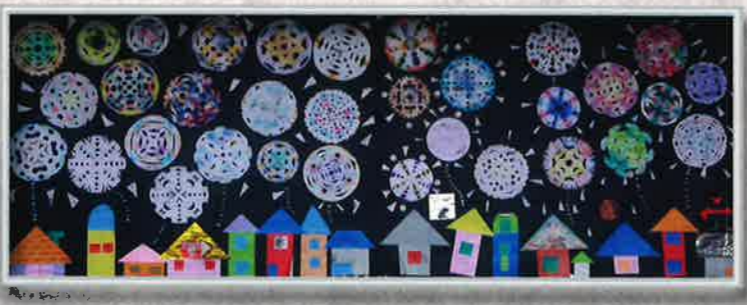
「打ち上げ花火」 デイとくら・輝 障子紙を水性ペンで染めました