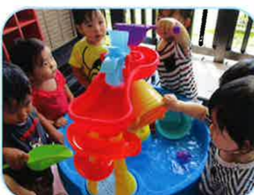
夏の暑さもへっちゃら！