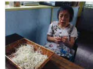
ポンポン作りは私が担当！！

作品作りには当たっては、1人1人出来る事が違う為、その人の出来る事や強みを活かして作品作りに参加して頂いています。一つの作品の工程を「工程①、工程②、梱包、値段貼り」と言うように細分化し、出来る事を行って頂いています。徐々に形になると嬉しい物で、完成するとみんな笑顔が溢れます。