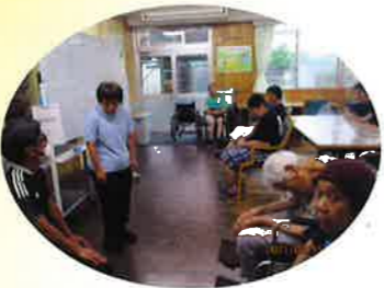
日曜日に行われる「さくらの会」の司会を務めています！！