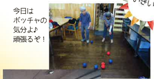
今日はポツチャの気分よ！頑張るぞ！