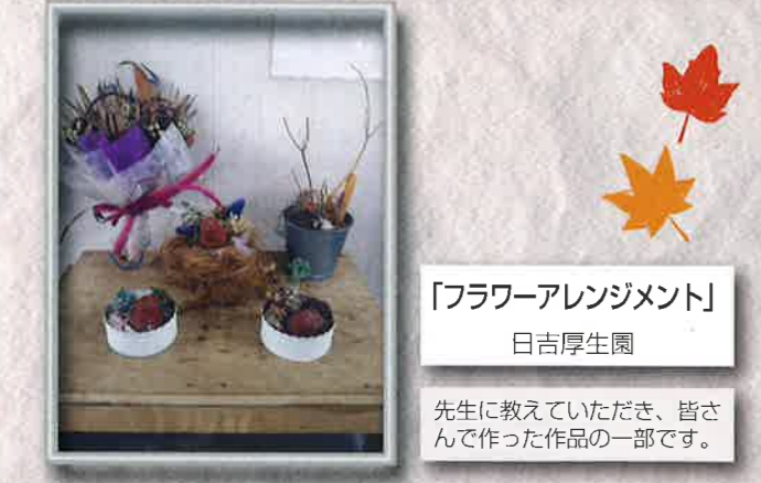
「フラワーアレンジメント」 日吉厚生園 先生に教えていただき、皆さんで作った作品の一部です。