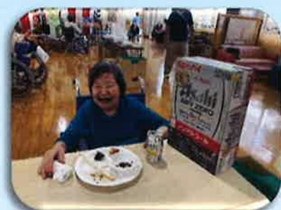
暑い日はやっぱりコシ！ お酒好きな人が多いです