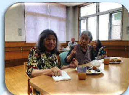
広い場所でゆったいと昼食です