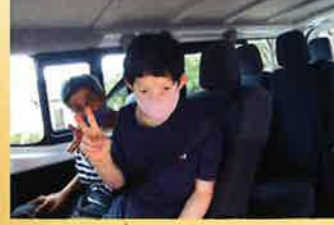
ドライブに出発ー！どの利用者さんにも大人気です