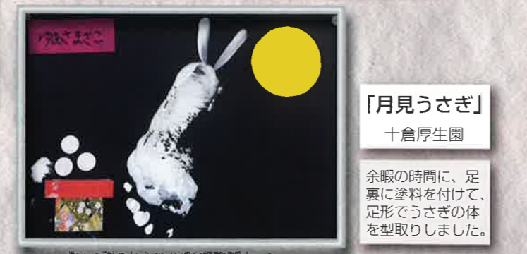
「月見うさぎ」 十倉厚生園 余暇の時間に、足裏に塗料を付けて、足形でうさぎの体を型取りしました。