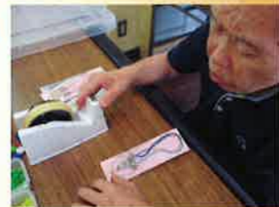
最後まで想いを込めて…