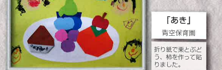
「あき」 青空保育園 折り紙で栗とぶどう、柿を作って貼りました。