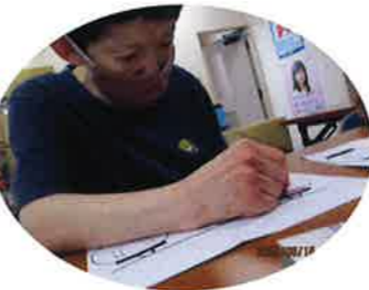
夏祭りの準備は私に任せてください！