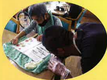
1ヶ月に1回のさくら食堂のお手伝い！ みんな何選ぶの～？