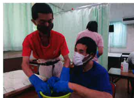
まずはクッキーを細かく砕きます

7月24日(土)の余暇支援は、午前中にチーズケーキ作りと、午後は園庭で水遊びを行いました。チーズケーキ作りはオレオクッキーを細かく砕くことから始まり、生クリームを泡立てたり、チーズクリームを柔らかくするためかき混ぜるなど工程が沢山あり大忙しでした。最後はかわいいカップにオレオとクリームを層になるように重ねて入れ、上にバナナやアラザンを飾り完成させました。酸味と甘みのバランスがちょうどよく美味しくいただきました。午後の水遊びは天気も良くとても盛り上がりました。水鉄砲やホースで水をかけ合い、一瞬でも暑さを忘れ涼むことができました。