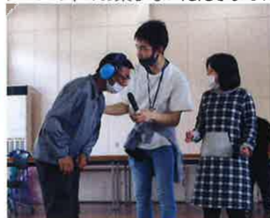
新しい利用者さんの紹介です