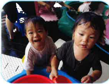
たっぷり水遊びができました！みんな楽しそう！