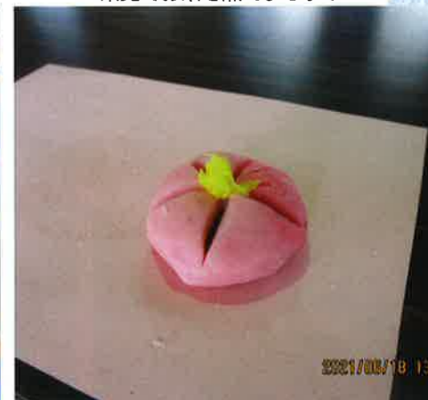
上手に練り切りが出来上がりました