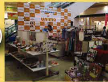
沢山の作品が飾られています