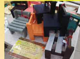
木活班が作った鉢置き。これに置いたら映える！

後日、協和厚生園の利用者さんにも売れた事を話すと、自身の作った商品がお客さんの手に渡った事が嬉しいと笑顔で話されていました。買って下さったお客さんも作った利用者さんも売り場に立った私も全員が嬉しかった販売会でした。