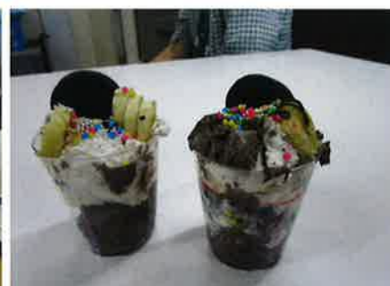
おいしそうです、早く食べましょう