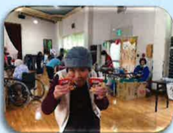
プレゼントを貰ってニコリ