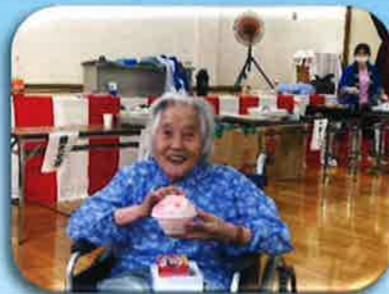
夏はやっぱりかき氷！ 練乳イチゴ味です