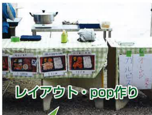
レイアウト・pop作り

4種類のお弁当を用意！金額が異なりましたが、お金の受け渡しは間違えることなく行えました！優秀です☆