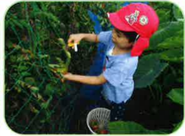
野菜の収穫もがんばります！