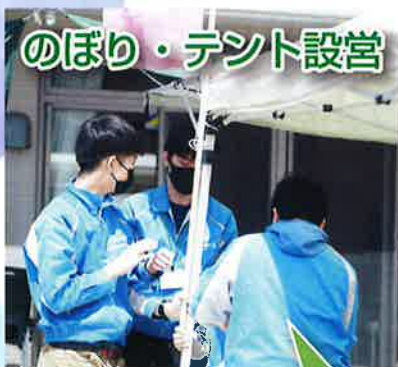
のぼり・テント設営

本来は外食を通じて社会人としてのマナーを学ぶ目的もあり、新利用者さんの歓迎を含め皆さんとの親交を深める行事となっていますが、今回は販売の流れ・イメージを持ってもらうため、販売経験の無い利用者さんを中心に模擬店形式で昼食を準備しました。