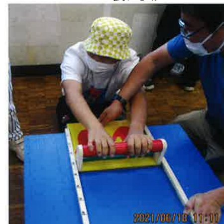
長座体前屈、体柔らかいのは誰かな