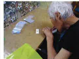
台紙きれいにいるかな？