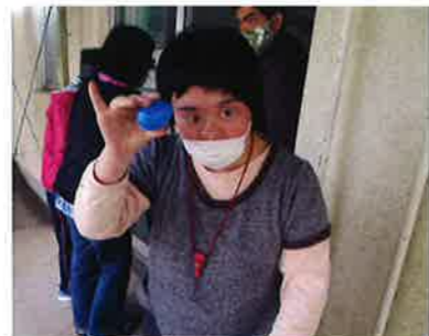
イースターエッグ見つけたよ