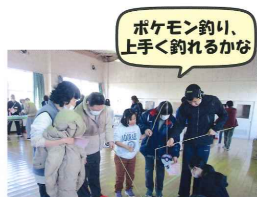
ポケモン釣り、上手く釣れるかな