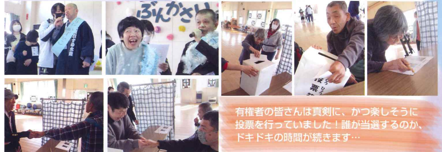
有権者の皆さんは真剣に、かつ楽しそうに投票を行っていました！誰が当選するのか、ドキドキの時間が続きます…