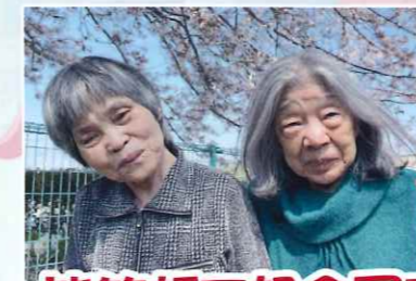
皆笑顔で記念写真!