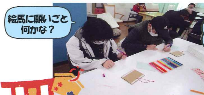
絵馬に願いごと何かかな?

1月21日(土)の余暇支援は絵馬作りや初詣など正月気分が味わえる企画で、年始の雰囲気を楽しんでもらいました。絵馬には今年の抱負や願いを書き、梅のシールを貼るなどして新春らしい仕上がりになりました。今回、訓練棟に手作りの大きい鳥居を設置し、賽銭箱も置いてお参りをしてもらいました。皆さん真剣な表情で手を合わせていました。午後はビンゴ大会をしました。ビンゴになると歓声が響き、キーホルダー、手袋、巾着など各々好きなプレゼントを選び、皆さん笑顔になっていました。