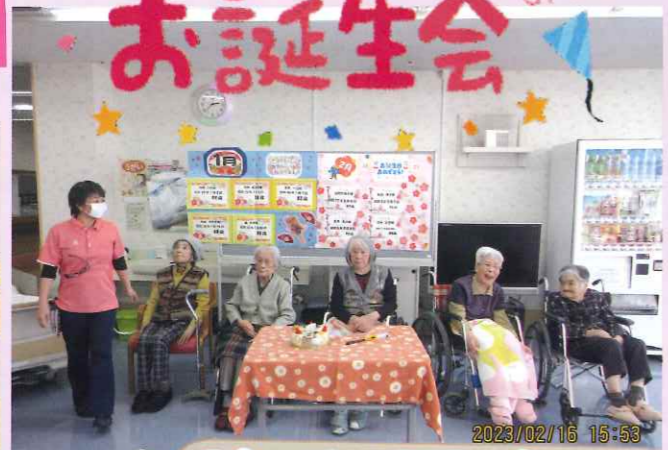
ハッピーバースデー!