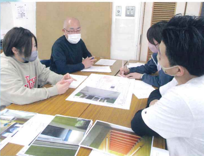
「リスクマップの作成」 場所ごとにどのようなリスクが潜んでいるのかを考えています。