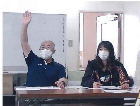
「講師役」 発言がしやすい様な雰囲気作り。

一度取り組んだ内容でも時間が経つと忘れてしまう事、また、新しい情報に切り替わっている事もありますので、常に勉強になります。