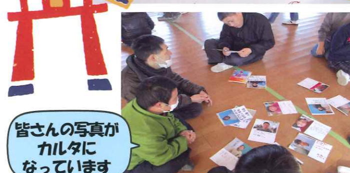
皆さんの写真がカルタになっています