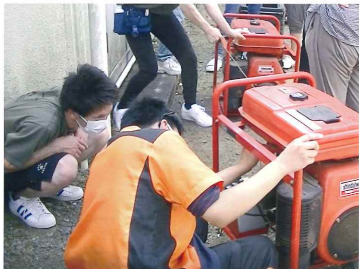
「発電機の使い方講習」 災害時に備えて発電機の使い方を確認しています。