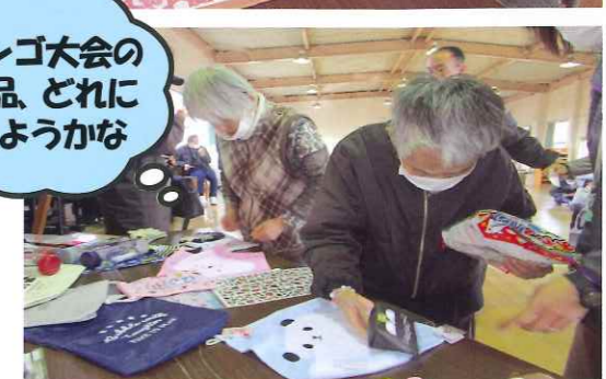
ビンゴ大会の景品、どれにしようかな