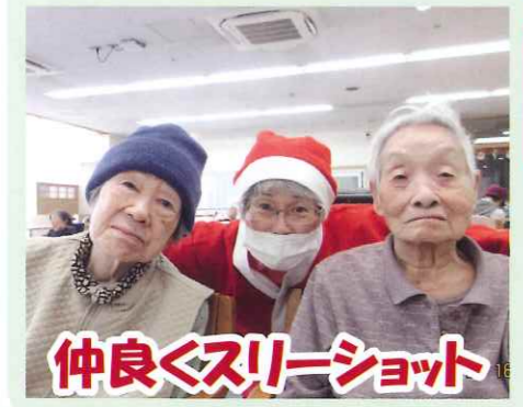
仲良くスリーショット