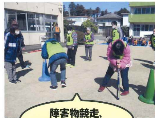
障害物競走、まずはバットグルグル