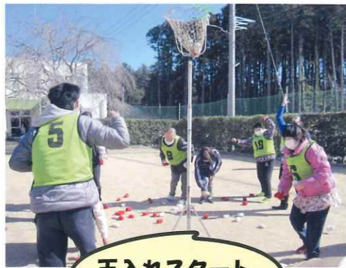
玉入れスタート、がんばれ!

2月21日(火)には、ひまわり会主催の行事が行われました。午前中は園庭で玉入れや、障害物競走などを行いました。風が冷たい日でしたが、寒空の下、皆さん張り切って参加していました。午後はゲーム巡りでした。もぐら叩き、金魚すくい、ポケモン釣りでは可愛い小道具が用意され、それらはひまわり会の役員さんの手作りでした。役員さん達の頑張りもあって皆さん楽しい一日が過ごせました。