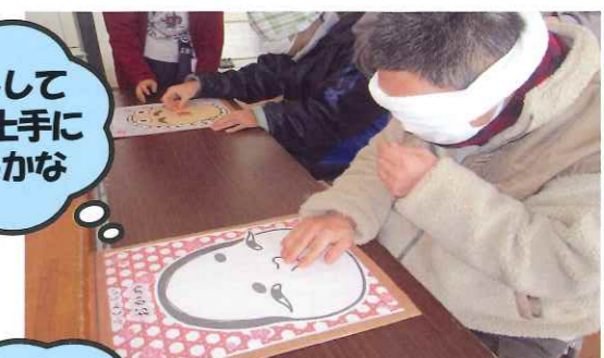
目隠して福笑い上手に出来るかな