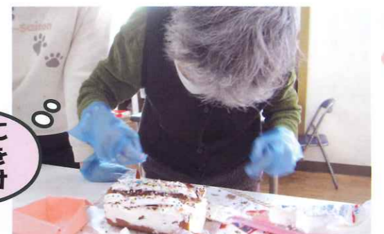
きれいにケーキを飾りつけ