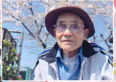
本当に綺麗ですね