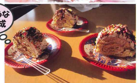
おいしそうなケーキ完成