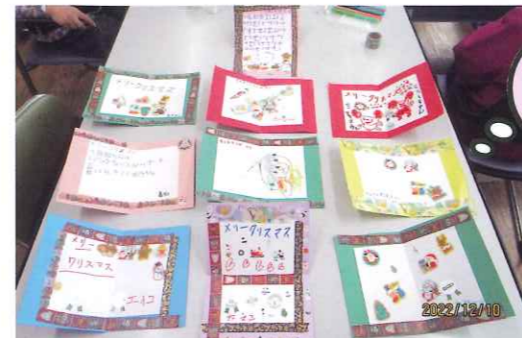
皆さんオリジナルのカード完成

12月10日(土)の余暇支援はクリスマスカードとケーキ作りを行いました。午前中はシールやカラーペンでカードを作成し、その後交換会をしました。みんなで輪になりカードを回し、音楽が止まったところで手にしたカードをもらいました。誰のカードをもらえるかドキドキでしたが、カラフルなカードを手にして皆さん嬉しそうでした。午後はグループごとにケーキを作りました。ロールケーキにクリームを塗り、フォークで木の模様をつけていきます。アラザンやピックで飾りつけ、ブッシュドノエルを完成させました。同じレシピでもそれぞれ個性が出ており、どれも美味しそうでした。