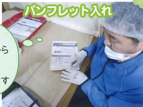
パンフレット入れ

こちらはパンフレットを5種類ずつ入れ、シールを留める作業です。同じものが重なって入らないよう十分に注意しながら入れる向きや裏表面の間違いがないように気を付けます。シールはズレが出ないように丁寧に合わせてから留めています。