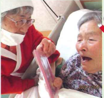
プレゼントにっこり