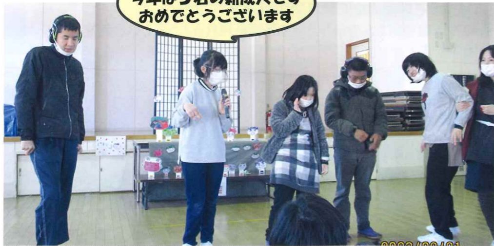
今年は5名の新成人ですおめでとうございます