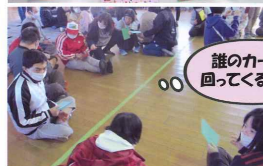
誰のカードが回ってくるかな?