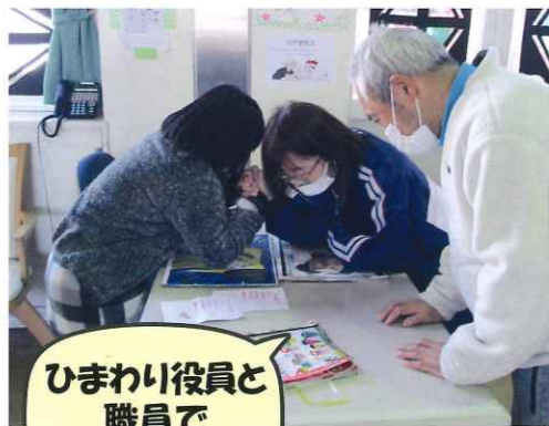
ひまわり役員と職員で腕相撲対決