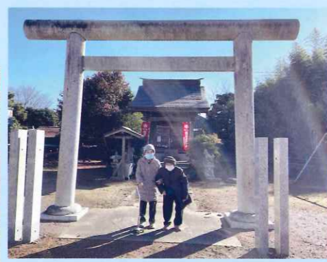
素晴らしい天気でした!