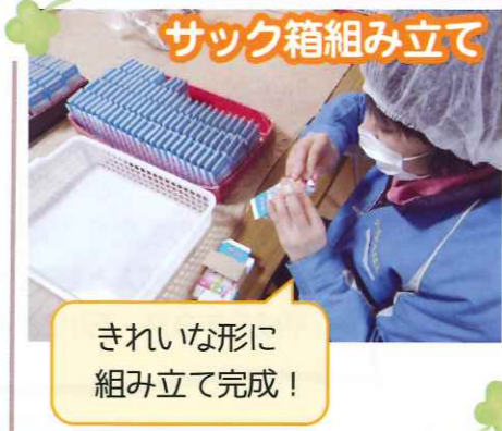
サック箱組み立て

企業 R 様からのお仕事は コインランドリー用の 柔軟剤シートの箱詰めです。 職員がカット後は利用者さんが 担当する工程へ。 1か月に1回の納品と部材の 入荷があります。