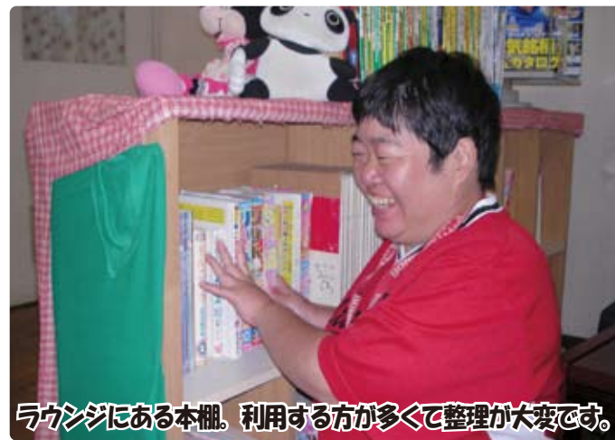
ラウンジにある本棚。利用する方が多くて整理が大変です。

けるかと話し合いを繰り返し、検討しました。その結果、係の種類を取り組みやすいものに縮小し、活動時間を各作業班の日課の中で都合のいい日時に行うなどの見直しを行いました。現在、給食係(毎日の給食メニューボードの写真カードを交換し、掲示する)は、職員からの声掛けがなくても時間になると率先して取り進む様子が見受けられるようになり、利用者主体で行われつつあります。他の係では、月1回ずつの実施で回数が少ないせいか、利用者・職員側の意識が薄れてしまうなどの課題が残されていますが、諦めずに「サポート」を続けていくことで、より主体的な活動につながるかと考えています。