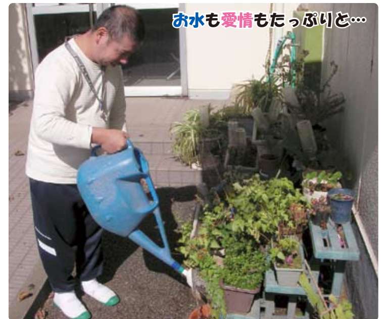
水も愛情もたっぷりど...

日吉厚生園では「ひまわり会」という利用者の代表者会が結成されています。利用者さん一人ひとりの投票により、役員が選ばれ、役員は皆の代表として、話し合いに参加し、選出行事の企画や新開づくりなどの活動を中心に行っていました。個人だけの考えではなく、全体のためにどのように意見をとりまとめようか、そうしたことを「考え」「話し合い」「意見を述べる」といった力を身につける取り組みでもありました。さらに一歩、全体での主体的な運営を目指して、係活動を新たに始めました。役員だけでなく、全員が係に所属し、役割を分担する事で、「皆の力で園を良くしていく」「自分達の事は自分達で行う」という利用者主体の活動を目指す試みです。